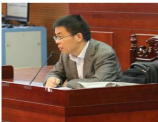
耿卓教授精彩讲授